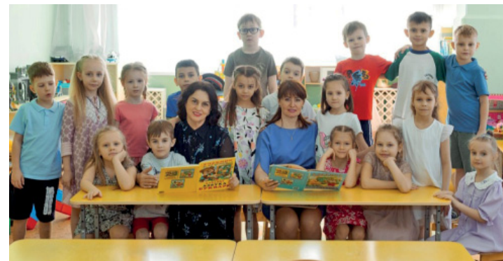
С благодарностью, родители группы «Лесовички», автор фото Анастасия Подпругина

В вашей ответственной и сложной работе желаем вам успехов, здоровья, терпения и благополучия! ■