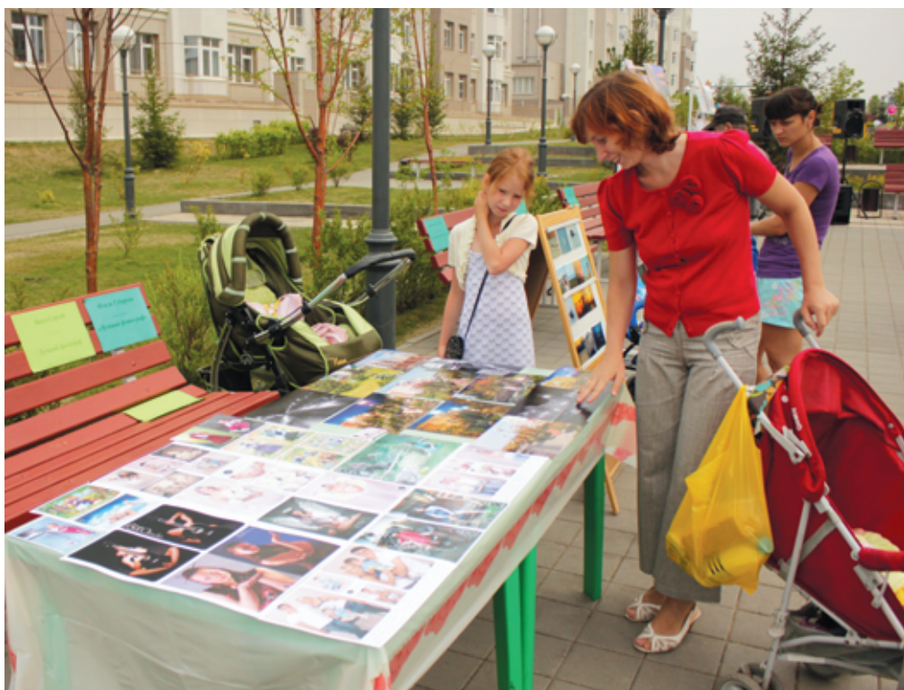
Больше всего участников выступило в номинации «Лучший фотограф».