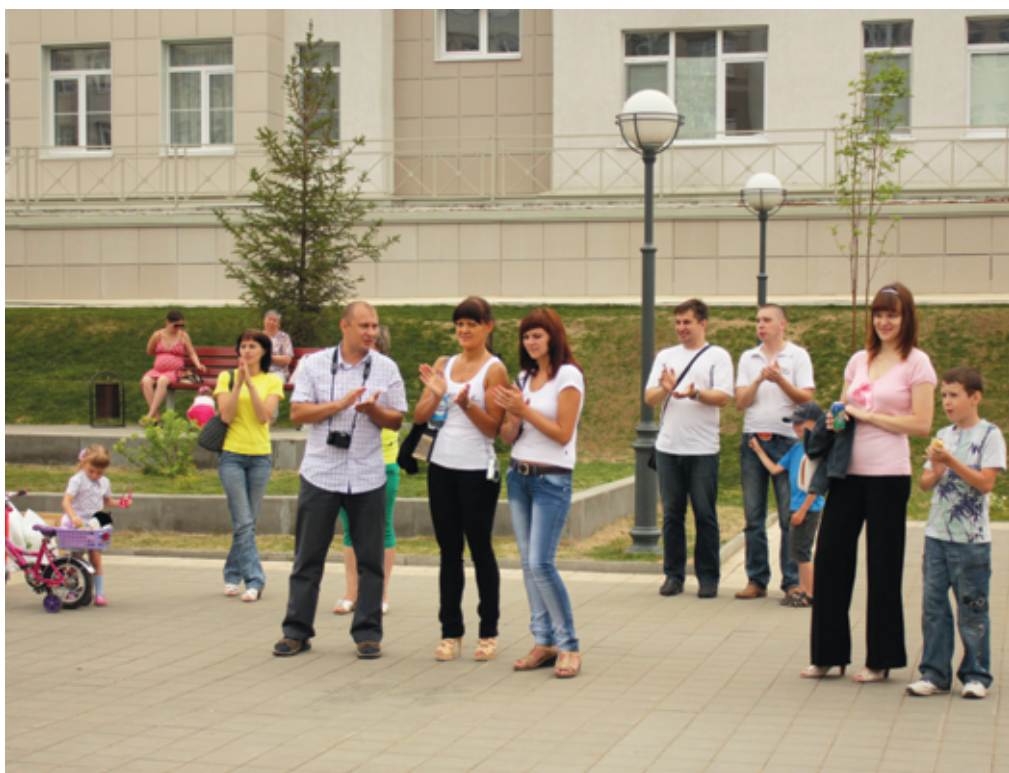
Временами понять, за кого стоит отдать свой голос, было непросто. Ведь номера своих друзей и соседей леснополянцы встречали «на ура».