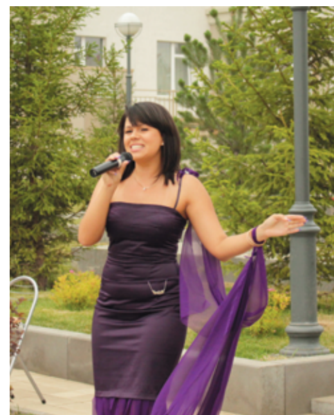
Многие жители решили раскрыть перед зрителями в День молодежи свои новые таланты.