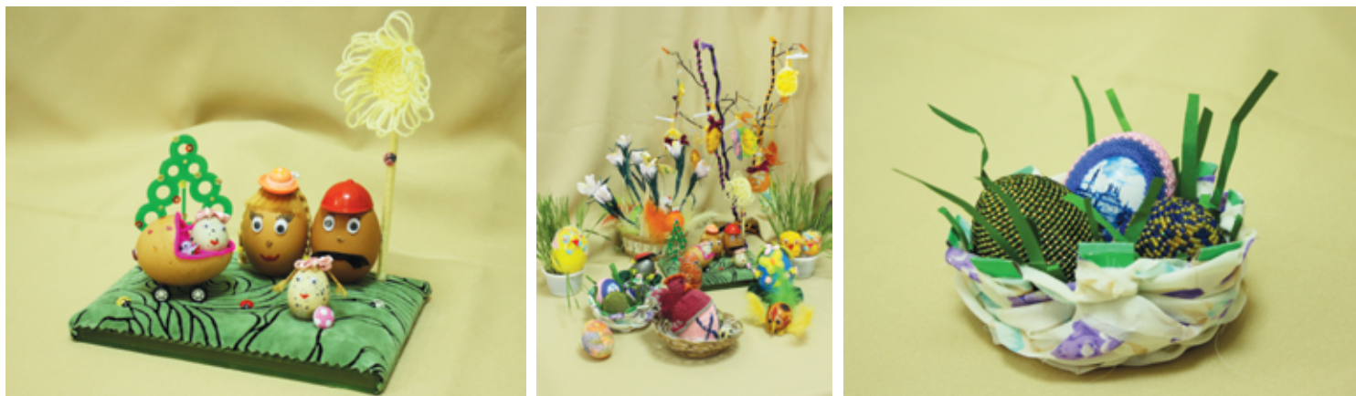
Слева направо: «Счастливая семейка» - 1 место, конкурсные работы, «” - Полина Гуцал