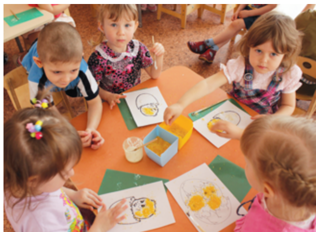
31 марта в Лесной поляне прошел субботник.