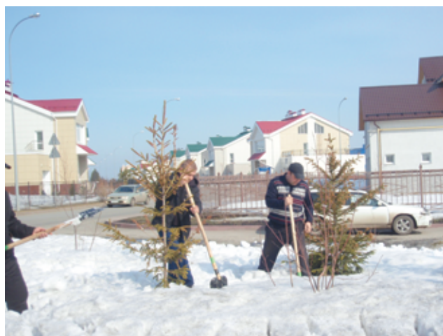
31 марта в Лесной поляне прошел субботник.