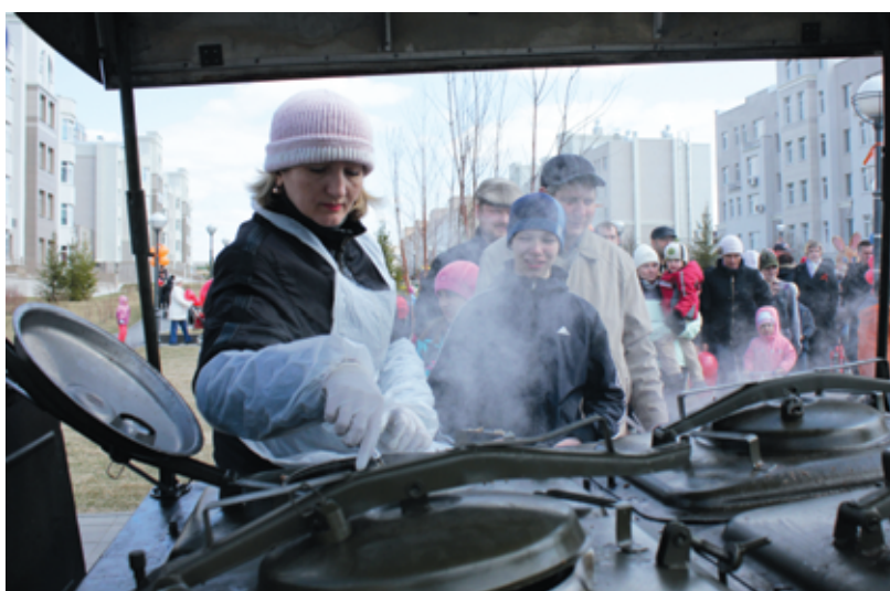
Желающие отведать гречневую кашу, приготовленную на полевой кухне, выстраивались в очередь.