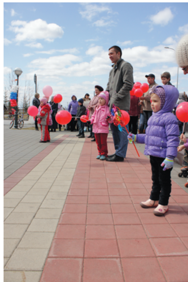
Большинство семей просмотрело праздничный концерт от начала до конца.