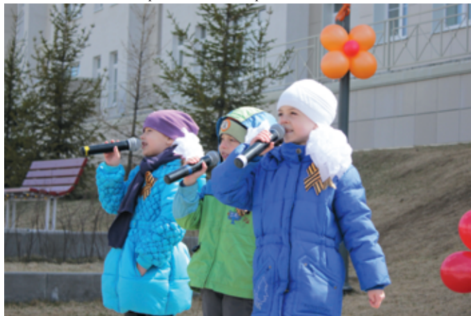
Коллектив детского сада «Лесная сказка»