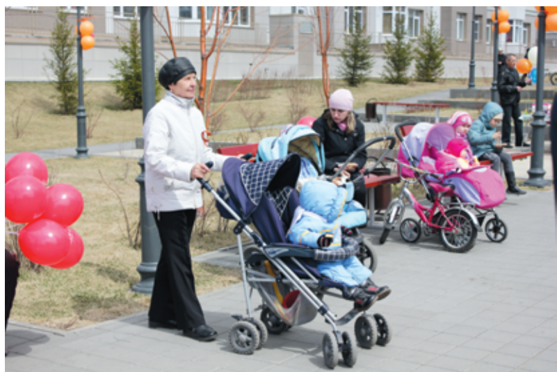
Следующим этапом празднования Дня Победы стал день отдыха «Мы помним, мы гордимся» на проспекте Весенний.