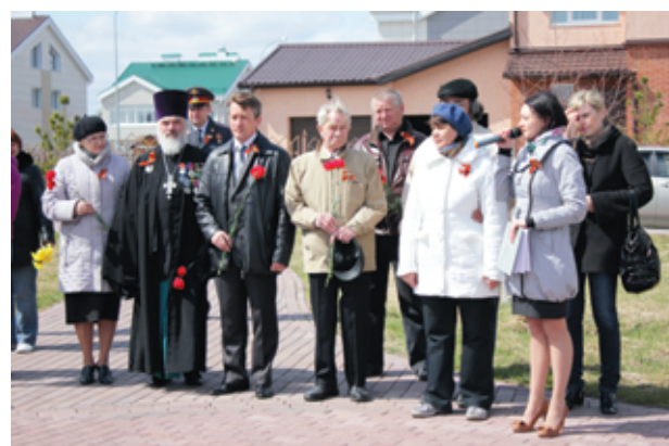
В 12.00 жители и гости района собрались в Сквере Победы.