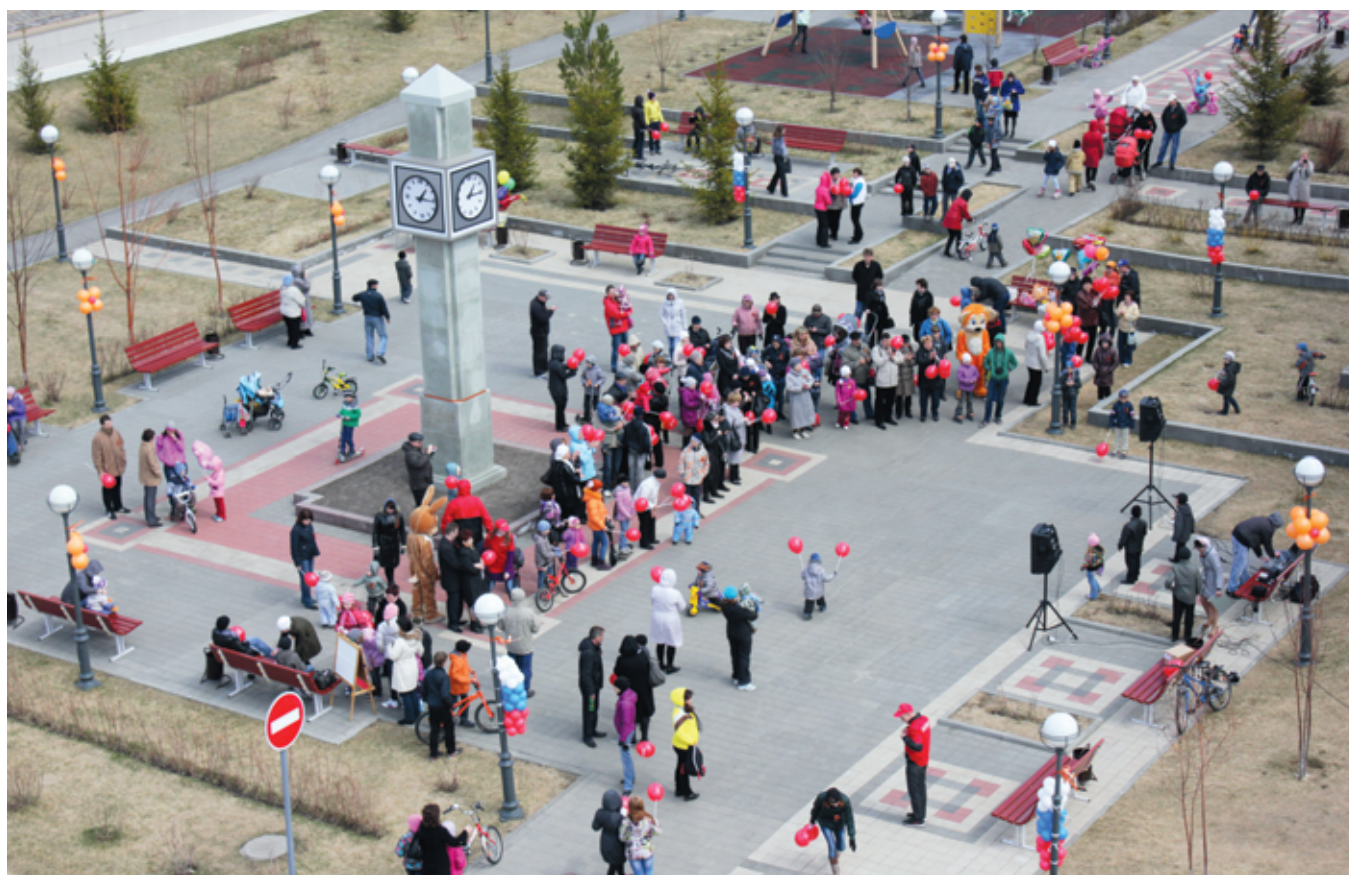
Девятого мая в Лесной поляне отмечали 67-ю годовщину Победы в Великой Отечественной войне.