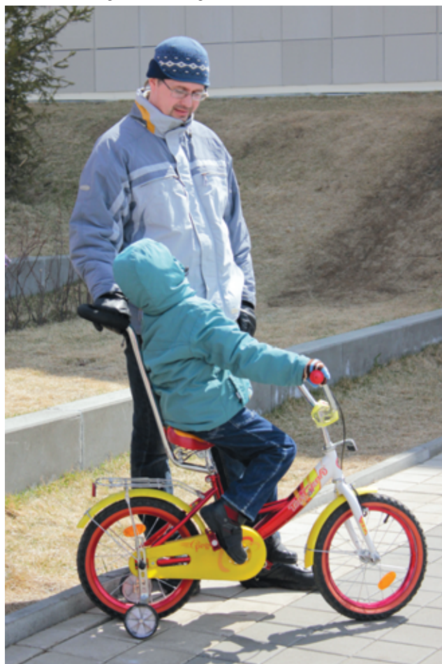
Ребятишки катались и на велосипедах, и на самокатах, и на электромобилях, и на роликовых коньках.