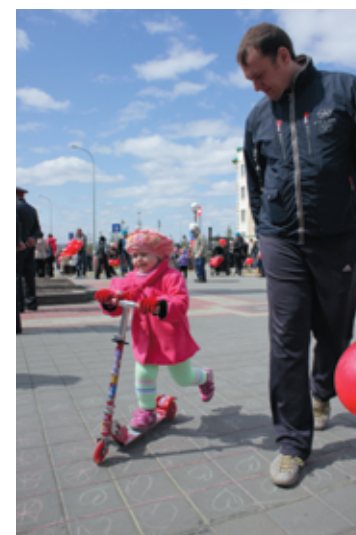
Несмотря на ветер, на проспект вышло много семей с детьми.