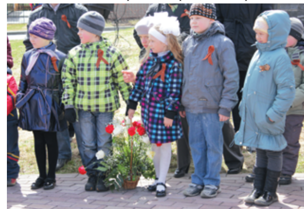
К памятному камню были торжественно возложены цветы.