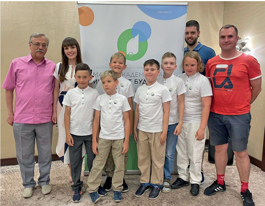
Делегация из Кузбасса, победившая в «Технической секции» конференции «Юный исследователь – Юг».