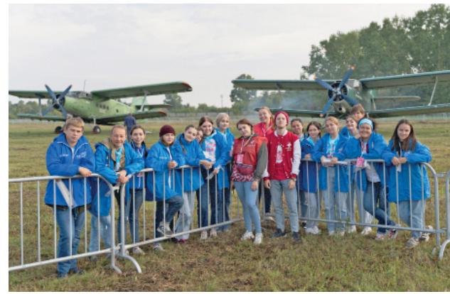
Волонтеры на «Небофест – 2022» – стр. 5