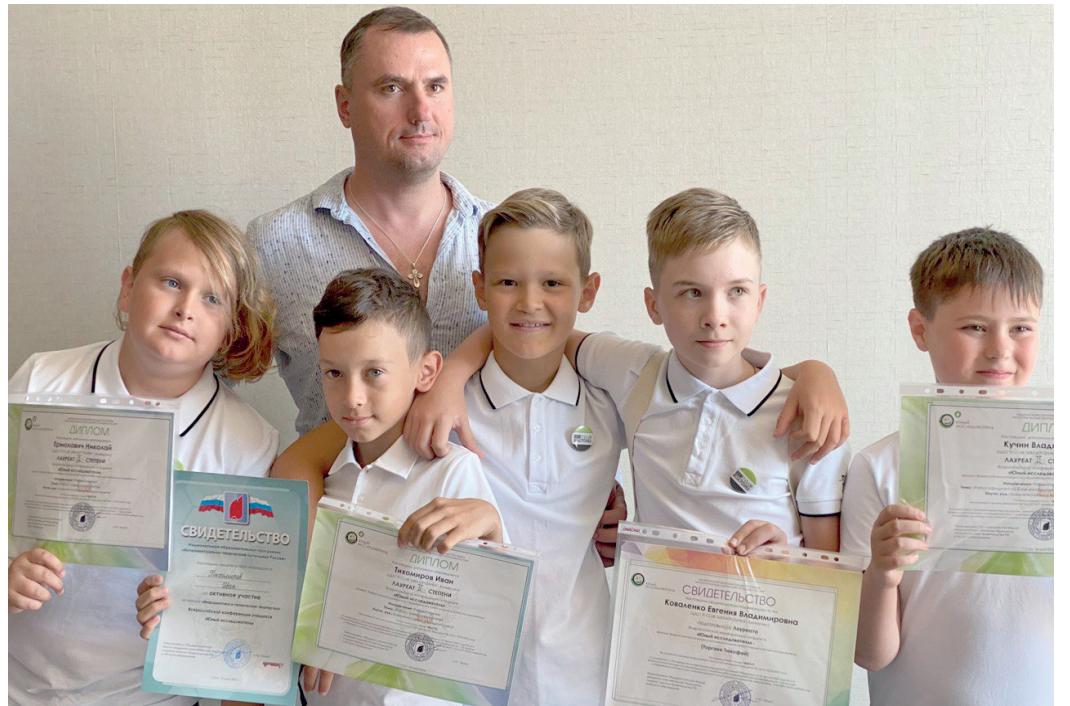
На конференции в Сочи ребята представили робота для ловли метеоритов в космосе с целью извлечения из них никеля.