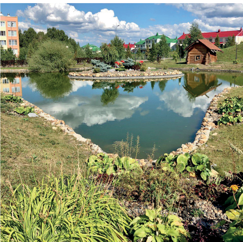
парк «Лесная сказка»