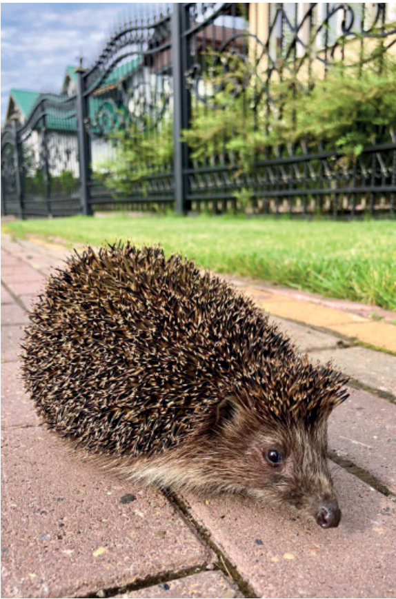
Ежик на Окружной