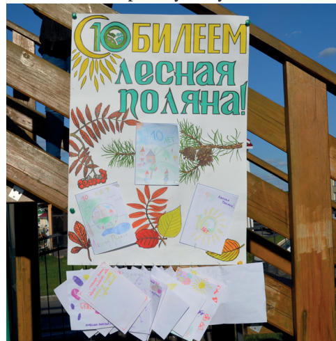
Коллективная открытка, созданная участниками всеполянского квеста. В будущем она будет украшать кафе «Спортград».