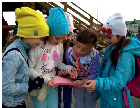
На станции туристической компании участники рисовали рисунки, из них делали самолеты, а затем запускали их в страны, где хотели бы побывать.

Весь день 29 сентября наш район праздновал свой первый большой юбилей. Гонки на беговелах, всеполянский квест, торжественное награждение активистов, фотовыставка, праздничный концерт и красочный салют – все это сделало день невероятно душевным по своей атмосфере.