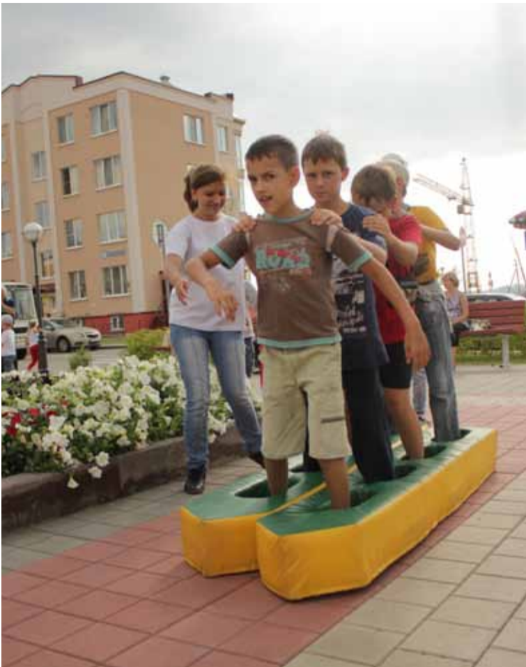
В ловкости, скорости и смекалке соревновались ребята самых разных возрастов: начиная от двух и заканчивая 15 годами.