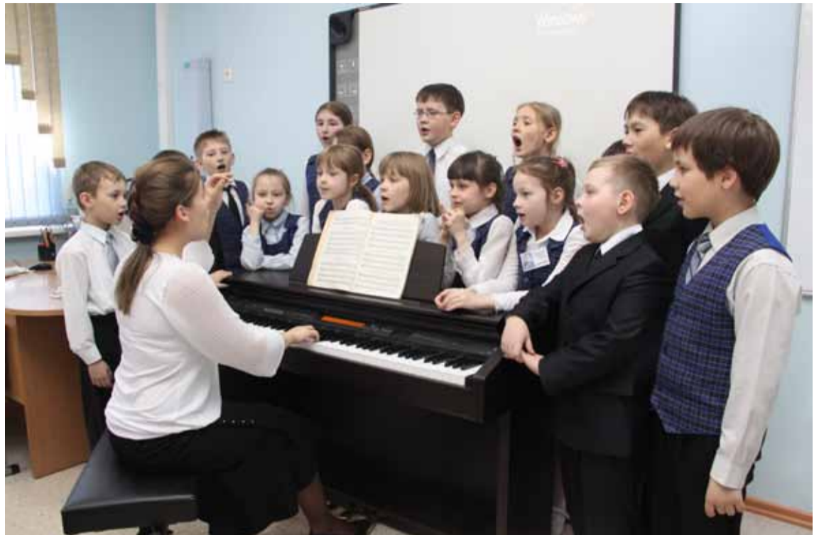
Ученики музыкального отделения Школы искусств на уроке сольфеджио. Занятия музыкальной способностью гармоничному развитию детей.

Здесь малыши смогут стать балеринами и балеринами. Кроме того, в программе для них предусмотрено изучение народно-сценического танца, историко-бытового танца, музыкальной литературы, нотной грамоты, игры на фортепиано, занятия гимнастикой и т.д. Уже набраны две группы первокурсников: 12 мальчиков и 12 девочек. «Одна из причин отдать ребенка на хореографическое направление – это эстетическая сторона, – считает Алексей Бегунов, педагог Школы искусств, артист балета Музыкального театра, преподаватель и аспирант КемГУКИ. – Ведь это красиво, когда ребенок умеет хорошо и красиво двигаться, для здоровья важно развивать мышечный аппарат. С другой стороны, возможно это станет его профессией в будущем».