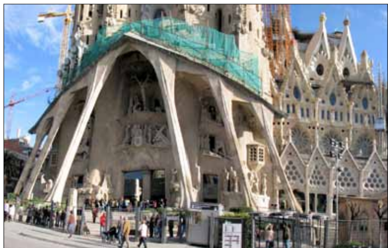
Встреча с Барселоной невозможна без знакомства с причудливой фантазией архитектора Антонио Гауди.

В-пятых, это море. На пляже можно не только позагорать, но и найти удивительные вещи. Например, в Испании на побережье Коста – Дорадо можно найти кусочки золота не только на пляже, но и в море. Путешествуйте и находите много нового, посещайте интересные и красивые места!»