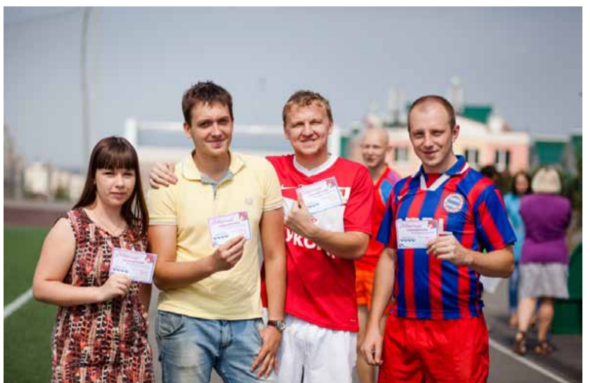
Счастливые победители конкурса «ЕВРОСОК-2012» отдохнули на полную катушку в спорткомплексе 5 августа.

Объявляется набор группы по лечебно-оздоровительной гимнастике. Лечебная физкультура выполняет не только лечебную, но и воспитательную функцию, развивает силу, выносливость, координацию движений, закаливает организм. Лечебная физкультура – обяза-