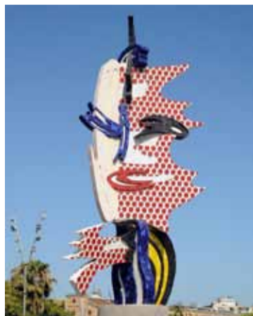
Статуя «Лицо Барселоны» доказывает: архитектура тоже бывает веселой.