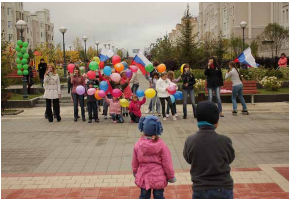
Ученики и преподаватели Школы искусств в День шахтера устроили праздничный концерт, показав, чему научились в учебном году.