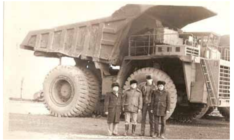
Семейный автомобильный стаж шахтерской династии составляет 130 лет. Если сыновья Семени Харитоновича управляли БелАЗами, то глава династии успел посидеть за рулем такого карьерного самосвала как МАЗ-523.

Культурно-образовательный центр МАОУ «Гимназия № 42» объявляет набор детей в студии, кружки и секции: ■ Фотостудия «Азбука фотографии» (от 11 до 17 лет), ■ Туристический клуб «Таурус» (от 9 до 17 лет), ■ Секция «Настольный теннис» (от 7 до 13 лет), ■ Секция «Футбол» (от 7 до 13 лет), ■ Музыкальная студия «Ассоль» (от 7 до 17 лет), ■ Клуб «Мамина школа» (от 2 до 4 лет), ■ Студия ИЗО «Волшебный мир» (от 5 до 10 лет), ■ Студия флористики «Солнечный мир» (от 8 до 11 лет).