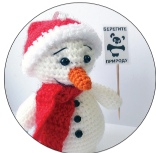
ФОТО ТУ ЖУР ЛЕСНАЯ ПОЛЯНА

В районном конкурсе «Новогодняя игрушка в ЭКО стиле для районной елки» участие принял 51 человек. Победителями стали: 1 место - Маркова Юлия Васильевна - вязаный снеговик; 1 место - Одношви-