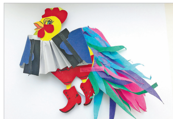
ФОТО ТУ Ж/Р ЛЕСНАЯ ПОЛЯНА