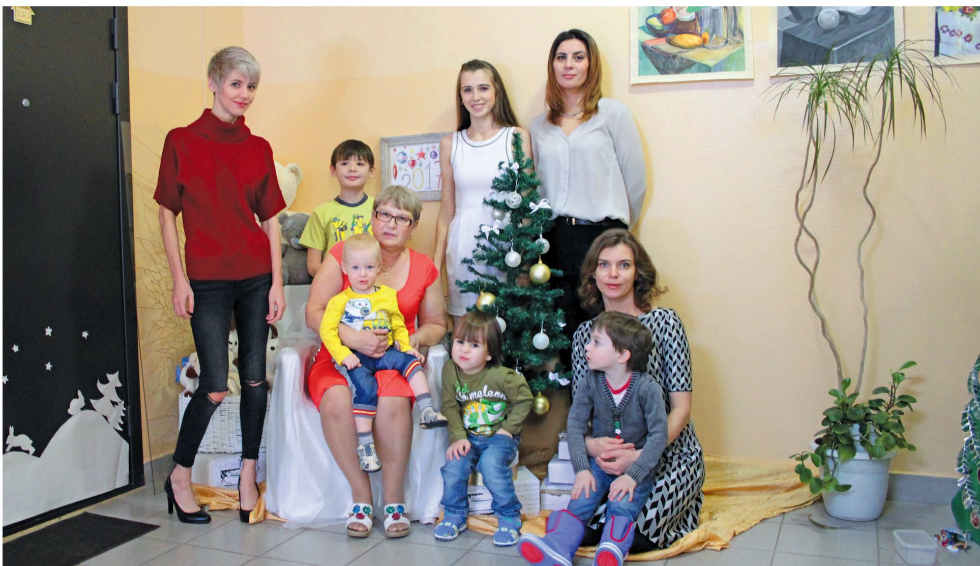
Победители смотра-конкурса в номинации «Новогодний подъезд» - жители подъезда №8 дома 28 по улице Окружная.