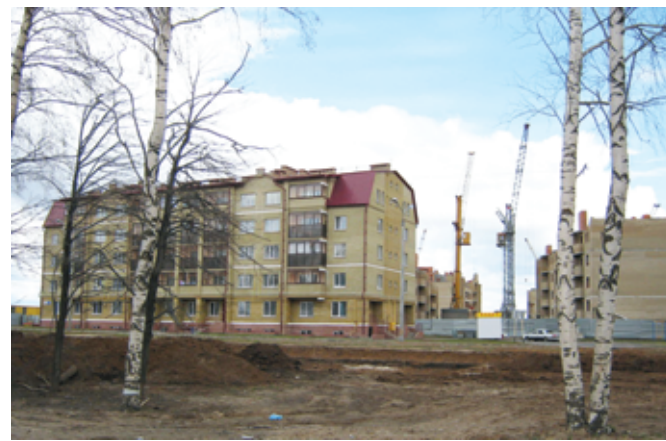
Новый город, Чебоксары

м. В нем будут построены секционные жилые дома разной этажности (до 17 этажей) и уровня комфортабельности. Первые этажи жилых домов будут отданы в коммерческий найм: магазины, кафе, клубы и т.д. Также будут предусмотрены офисные и гостиничные здания с подземными и открытыми паркингами. В районе планируется строительство 4 школ, 10 детских садов, нескольких физкультурно-оздоровительных комплексов, взрослой и детской поликлиники и даже станции «Скорой помощи». Кроме того, согласно проекту в районе будет возведен открытый стадион на 10 000 зрителей, школа искусств и библиотека. В целом планируется создание современной комплексной энергоэффективной инфраструктуры жизнеобеспечения, которая улучшит условия жизни для всех слоев населения.