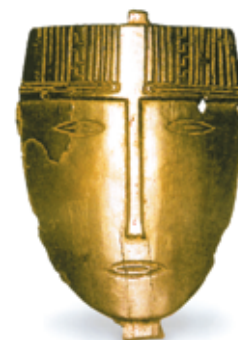
Фото из архива Музея археологии, этнографии и экологии Сибири*