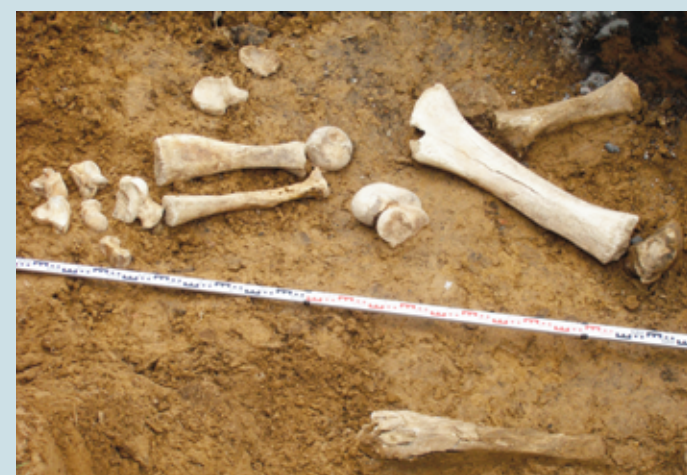
В 2005-м году в поселке Комиссарово (Кемеровский район) были случайно обнаружены кости целой особи мамонта. Для наших краев это уникальный случай – находка практически целого скелета. Его возраст оценивается исследователями в 13 – 15 лет. А жил он ни много ни мало – 20 700 лет назад.

· Изображение всадника. Его длина составляет по-