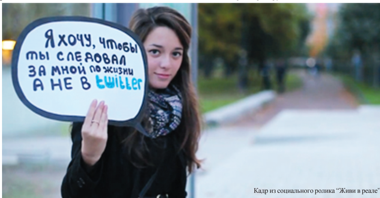
Кадр из социального ролика «Живи в реале»

По мере прогрессирования зависимости виртуальный мир постепенно становится все более привлекательным, в то время как реальный воспринимается не интересным, скучным, а зачастую и враждебным.