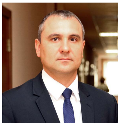
Уважаемые жители Лесной Поляны!

В эти праздничные дни мы провожаем год уходящий, который был непростым. Но все же хорошего было больше. И в жизни района, и я надеюсь, в вашей жизни. Лесная Поляна развивалась, строилась, хорошела и будет продолжать это делать.