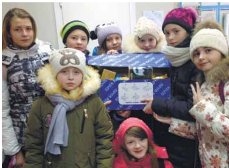
Ученики 6 «Г» отправляли посылку всем классом.