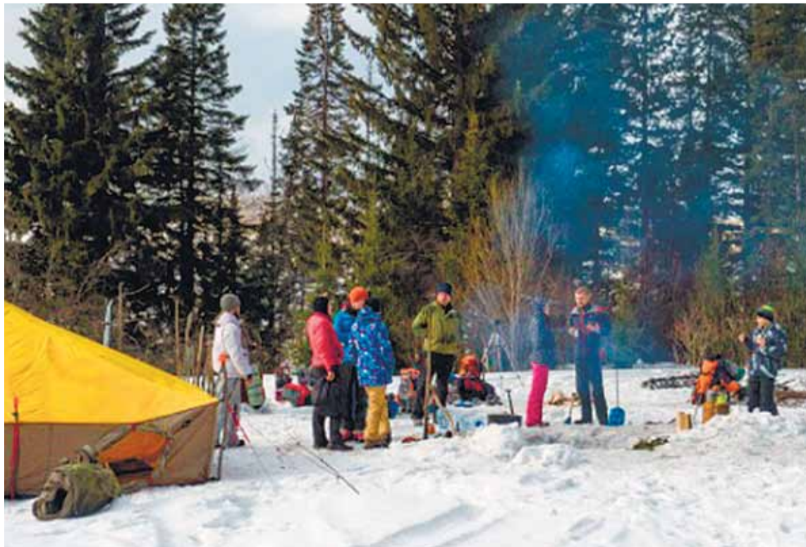
Походы это не только вид отдыха. Проводя больше времени на природе, человек учится бережно к ней относиться.