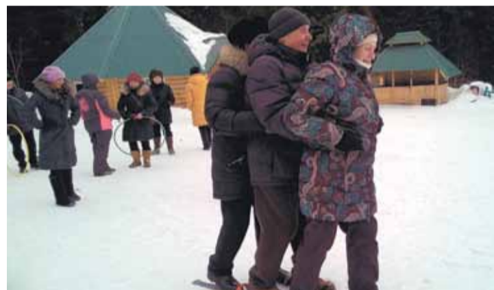
ФОТО ТУ Ж/Р ЛЕСНАЯ ПОЛЯНА

В первый день весны Совет ветеранов жилого района Лесная Поляна посетил спортивно-рекреационный комплекс «Таежная заимка». Ветераны получили массу незабываемых позитивных эмоций и заряд энергии. Чудесная атмосфера, располагающая к ком-