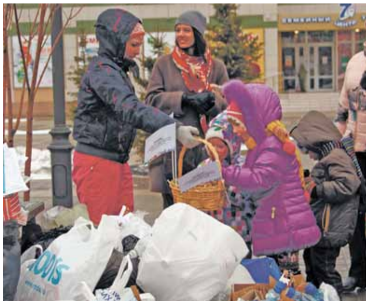
Сдай макулатуру, получи конфету – выгодный обмен!

В нашем замечательном районе прошла эко-акция «Мир без вреда». 26 марта жители сдавали пластиковые, стеклянные бутылки и макулатуру, получая взамен вкусные конфеты. На мой взгляд, это – отличная идея для того, чтобы привлечь детей к этой проблеме, а для взрослых – повод рассказать подрастающему поколению о проблемах окружающей среды и о деятельности человека, пагубно влияющей на нее.