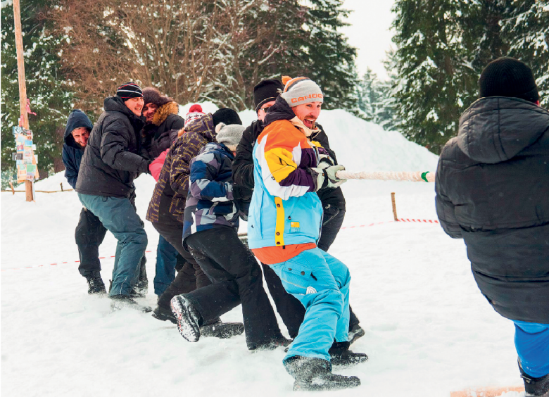
ФОТО - ТАЙННАЯ ЗАПРАВКА