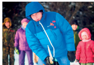
ФОТО «ТАЕЖНАЯ ЗАЙМКА»