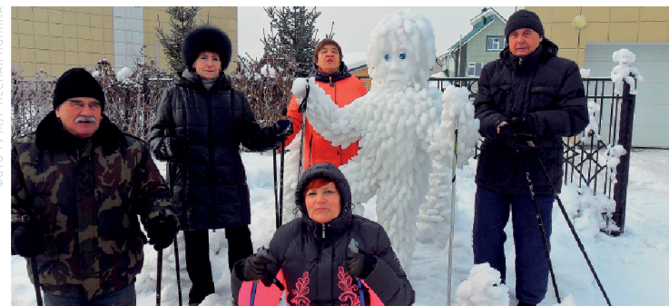
ФОТО ТУ ЖУР ЛЕСНАЯ ПОЛЯНА