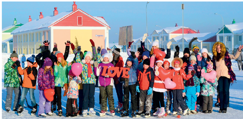
Арт-группа «Априори», The Maska.ru и газета «Наша Лесная Поляна» устроили 14 февраля яркую фотосессию "Love каток" в парке Лесная сказка