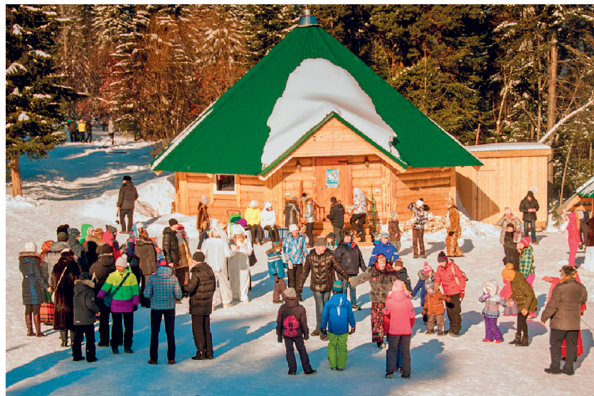
ФОТО ТАЕЖНАЯ ЗАИМКА