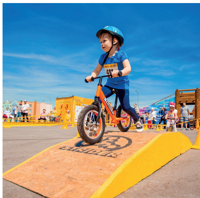
40 малышей от 1,5 до 6 лет освоили трассу с препятствиями и крутыми виражами.