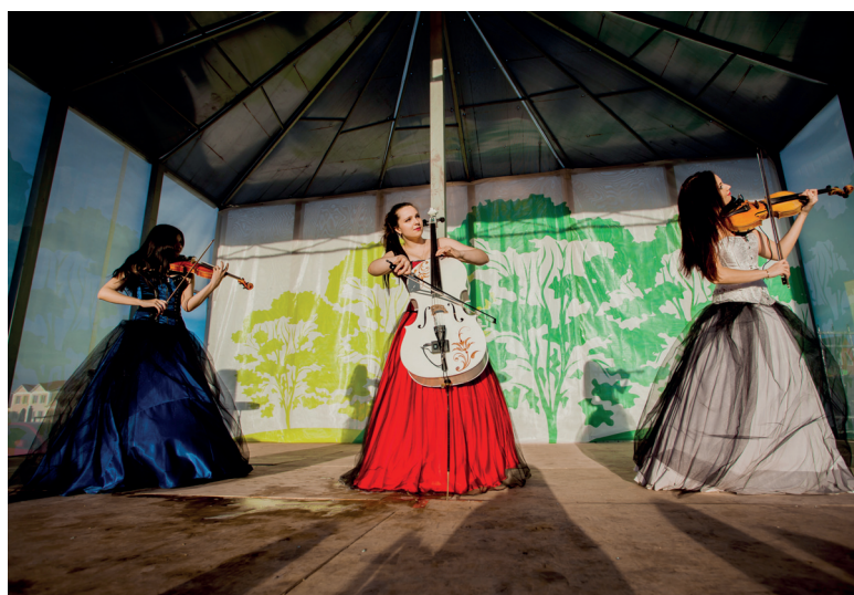
Материал предоставлен ТУ Лесной Поляны

циклом. Примерно в это же время начало работу кафе, в котором можно было отведать в том числе и шашлычок местного «посола». Мастерицы выставили на продажу свой милый ассортимент. Аквагрим, стенд с рисунками, катание на водных шарах, батуты, а также танцевальные мастер-классы, концерт от наших местных танцевальных и вокальных коллективов. Украшением вечера стали специальные гости – инструментальное трио «Silenzium». Это только начало летнего сезона!