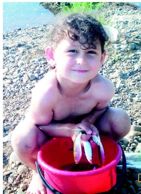
Как вы отдыхаете семьей?