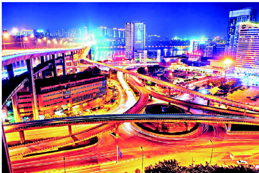
Проект развязки по смене стороны движения в Макао