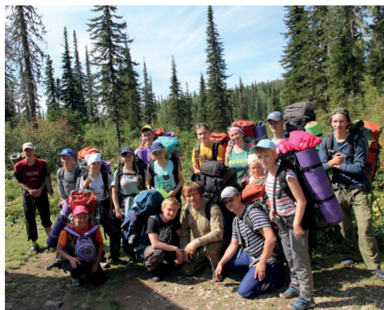
Поход на Поднебесные зубья.

«Сейчас ключевая фраза на страничках соц. сетей – «Как быстро пролетело время». Нет, у нас оно не пролетело. Пролетело у тех, кто привел детей в 1-й класс и забрал в 11-м. Мы прожили это время вместе с детьми. Мы были ближе к ним – на фоне этого общения какие-то моменты не упустили. Были рядом – нам всегда было о чем поговорить, несмотря на трудности и заня-