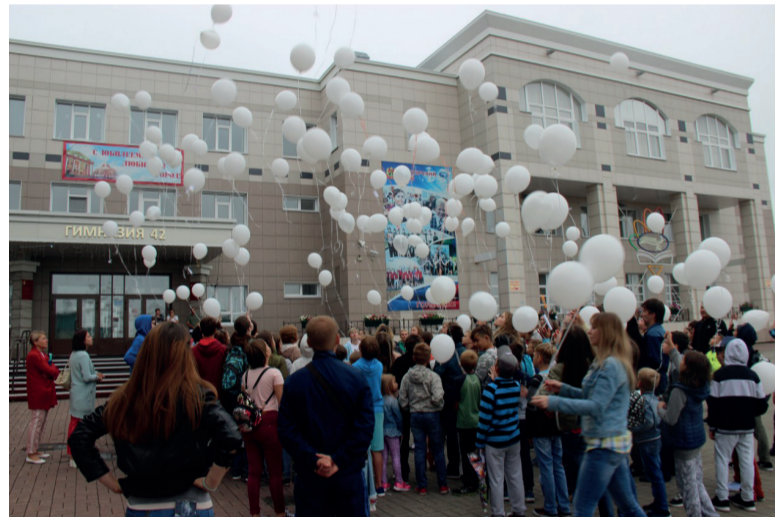
24 июня коллеги, родители и ученики собрались на территории гимназии №42, чтобы отпустить в небо шары со словами благодарности.