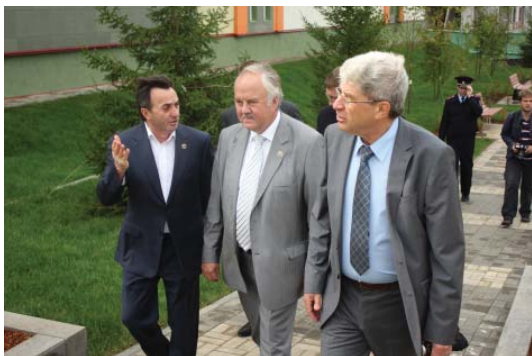
подпись к фото

конечно же, детская площадка ждут леснополянцев. А восхитительная вечерняя иллюминация и фонтан порадуют всех. Теперь еще одно прекрасное место доступно жителям и гостям Лесной поляны для прогулок.