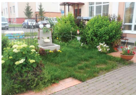
ул. Молодежная, 5-3