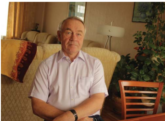
подпись к фото