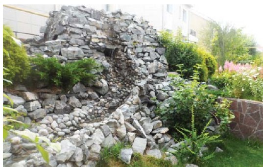
ул. Щегловская, 21 А