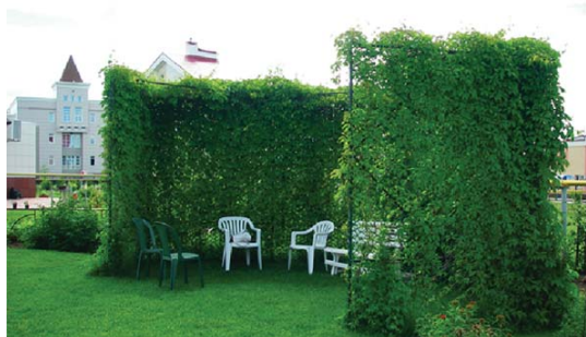
ул. Щегловская, 11