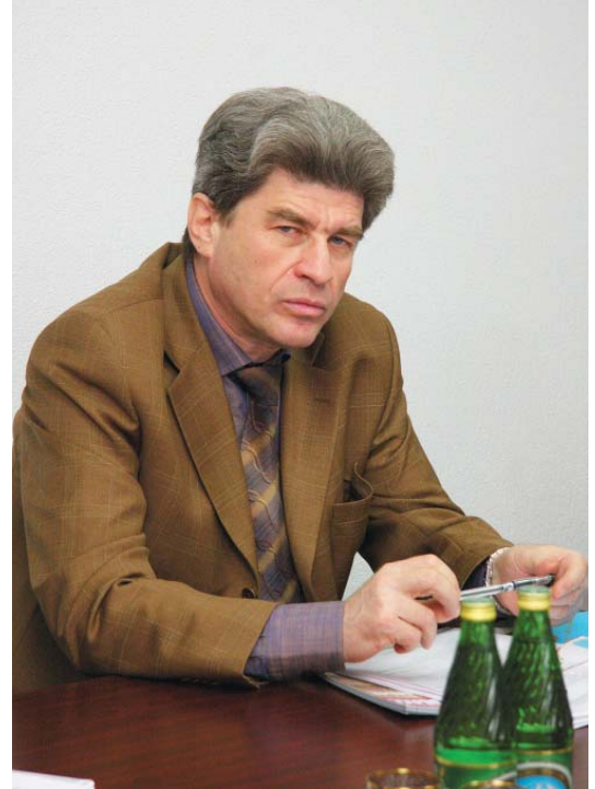
подпись к фото

И все же главное, от чего зависит успех нашего проекта – это мы с вами. От того, как мы будем любить наш город, как будем уважать друг друга, как будем расти и развиваться вместе с нашей Поляной. Наверное, это самая сложная задача и решаться она будет постепенно, каждый день, месяц и годы. Но и сегодня нам есть чем гордиться. Большинство леснополянцев любят и дорожат своим районом. Наши гости и будущие жители замечают, что люди в Лесной поляне доброжелательны, культурны и берегут свой город. За это большое вам спасибо! Разрешите поздравить всех с нашим первым юбилеем, пожелать, чтобы вам сопутствовала удача, и чтобы в вашем доме всегда было тепло. С праздником, с юбилеем!