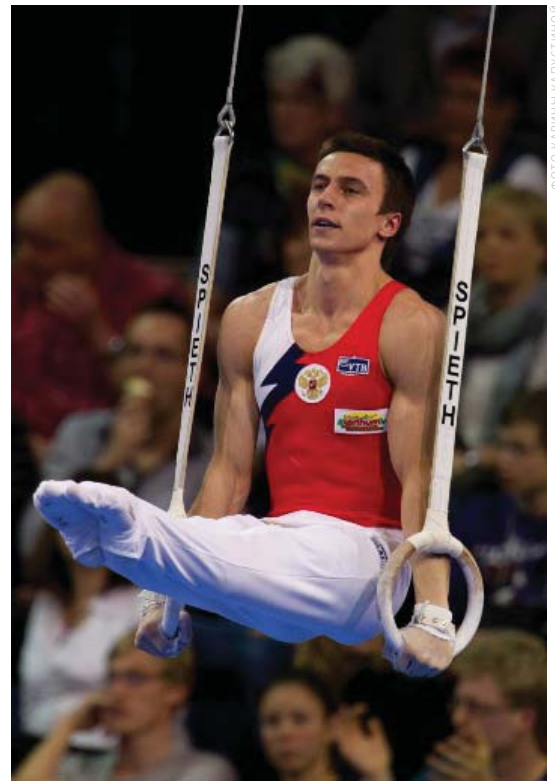
Спортивная гимнастика в г. Кемерово